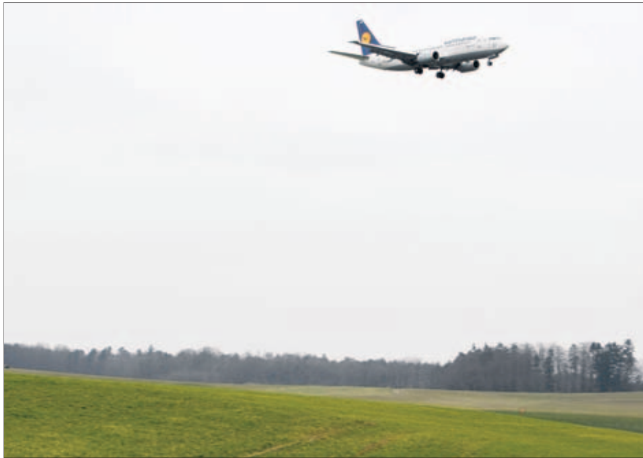
Rund um den Flughafen nur grüne Wiesen: Das würden der kantonale Richtplan und der ZFI gerne sehen. Dagegen, dass auf eingezontem Bauland nicht gebaut werden darf wegen des Fluglärms, wehrt sich Hanspeter Lienhart. (Sibylle Meier)

Das Unterland ist trotz des Fluglärms ein attraktives Wohngebiet. Wer hier wohnt, ist schnell in Winterthur oder Zürich. Ich bin nicht der Meinung, dass