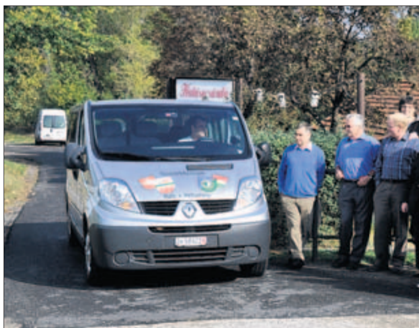
Der Bus aus Rafz läutet 400 Kilometer von Budapest entfernt so etwas wie das Zeitalter des öffentlichen Verkehrs in Hetvehely ein.

In den vergangenen Jahren war hauptsächlich die Gemeinde Rafz aktiv und stand der Partnergemeinde finanziell bei. Jetzt aber entschlossen sich ei-